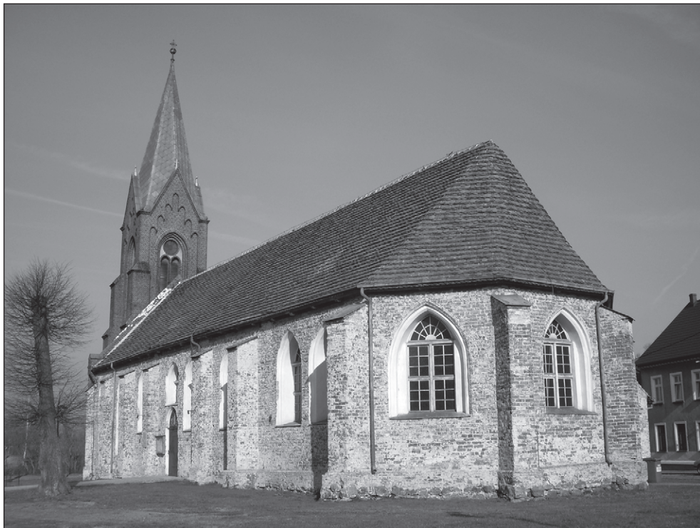
Ilustr. 2. Nowe Warpno. Widok na świątynię od strony południowo – wschodniej