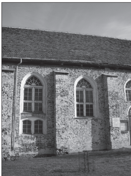
Ilustr. 3. Nowe Warpno. Fragment ściany kościoła od strony południowej, z widocznym wątkiem