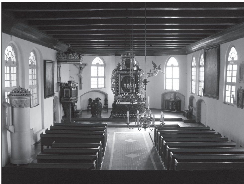
Ilustr. 4. Nowe Warpno. Widok na kościół z chóru muzycznego