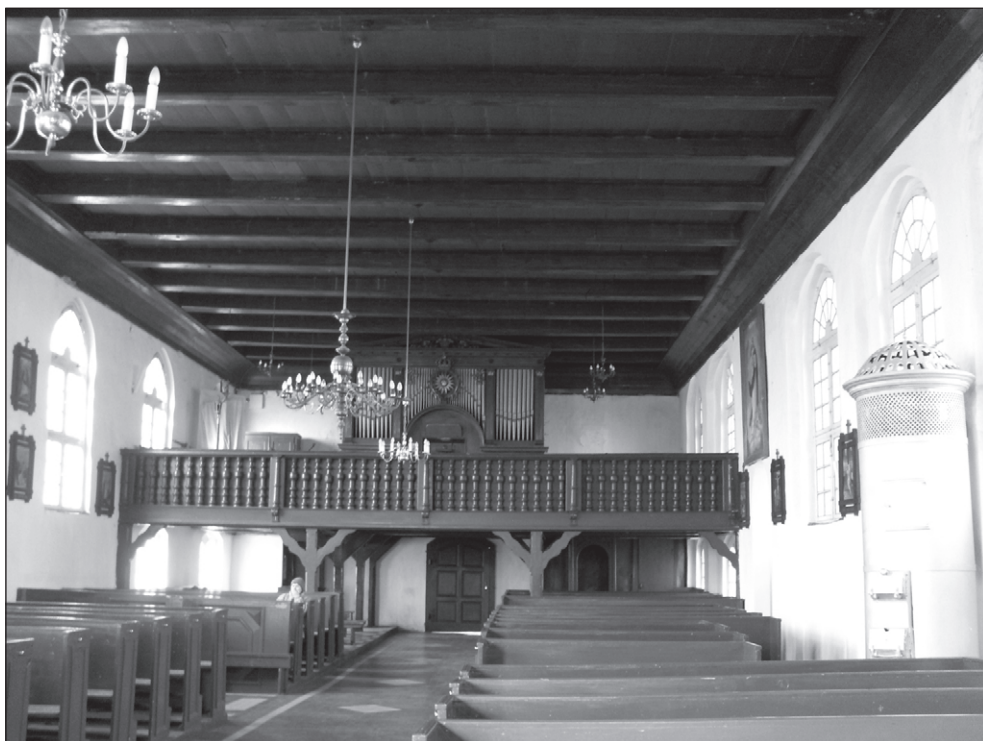
Ilustr. 5. Nowe Warpno. Widok na empore